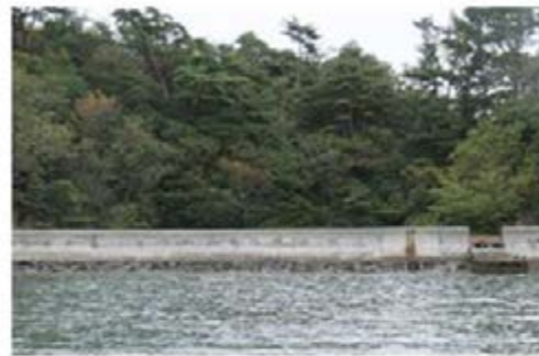
県の計画で修復予定となっている無人島の防潮堤=1日、宮城県塩釜市の大森島

4島では以前、稲作が行われ、水田を保護する農地海岸整備事業として防潮堤が建設された。しかし、現在は誰も農業をしておらず、水田だった場所は硬い泥地となっている。